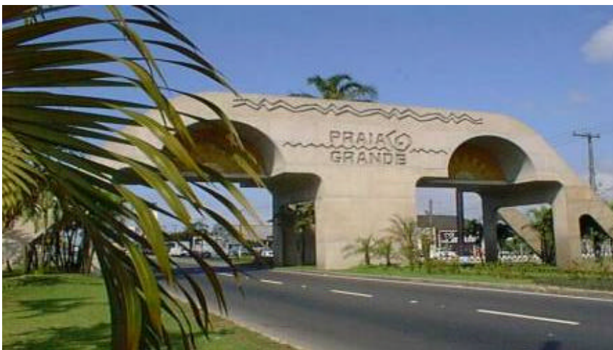
Anexo 1: Portal da cidade